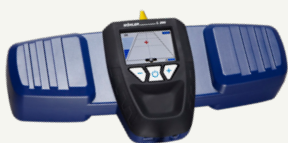
Wöhler L 200 Lokator Artikal br. 7430 J